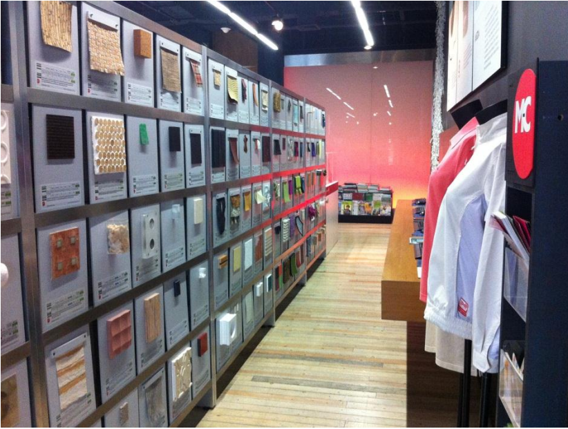
參觀創意設計中心