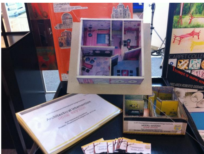
參觀設計學院學生作品