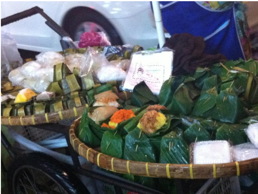
泰國當地文化體驗